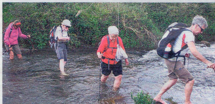
Keväisillä patikkaretkillä Israelissa saa ylittää myös viilentäviä vesiuomia.

kea koko Israel-polku läpi kymmenen viikon aikana. Vaellus jaksottuu yhteensä viiteen kahden viikon matkaan.