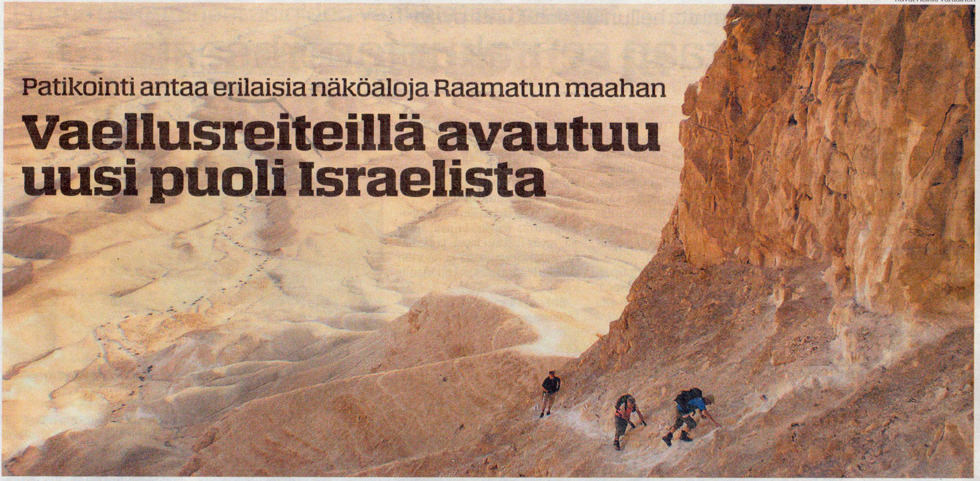
Negevin maisemia ja nousuja.