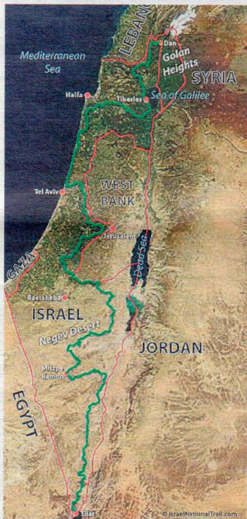
Danista Eilatiin ulottuva Israel-polku on tuhat kilometriä pitkä vaellusreitti.